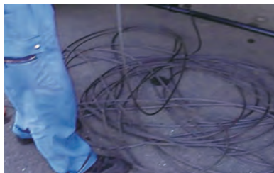
② 古いワイヤ取り外し