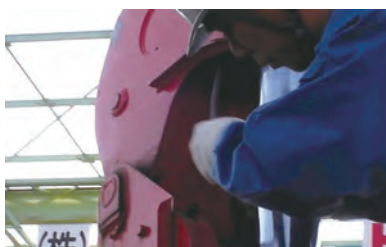
⑤ ドラム部分ワイヤ取付