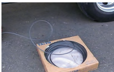
④ 交換ワイヤ巻き入れ開始