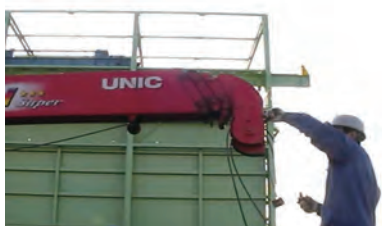
① ブーム先端のワイヤ取外し