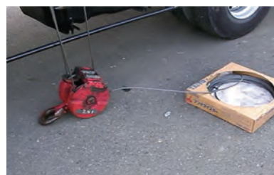
⑥ 交換ワイヤ巻き入れ