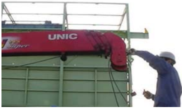
① ブーム先端のワイヤ取外し