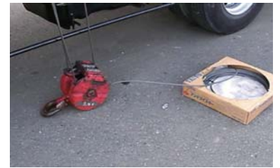
⑥ 交換ワイヤ巻き入れ