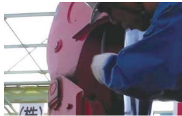
⑤ ドラム部分ワイヤ取付