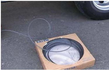
④ 交換ワイヤ巻き入れ開始